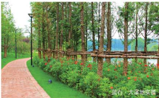
蓝石·大溪地实景图

泉城不乏高端楼盘，但为打造高端社区而寻遍全球，在建筑史上都属罕见，蓝石·大溪地做到了。大溪地的工作人员不无自豪地向记者介绍：从社区规划之初到后期建造，蓝石·大溪地不惜重金聘请了德国著名建筑师、WWA建筑师事务所创始人沃夫兰·约尔、美国顶尖室内设计师贝茱丽等来自美国、德国、日本、