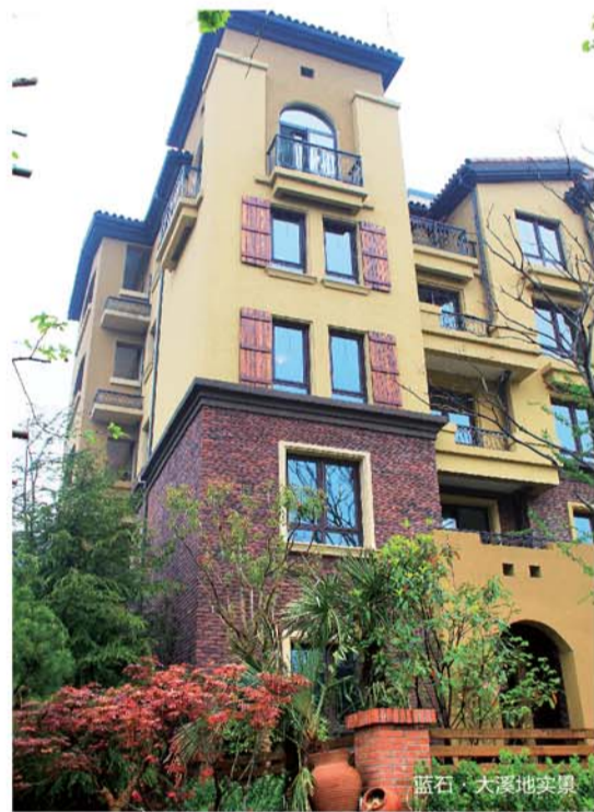
蓝石·大溪地实景图

精装庭院： 蓝石·大溪地精装庭院体系倡导的是“内外兼修”，利用软质景观、硬质景观有机结合。庭院内布置有精致花钵、铁艺；还有庭院照明设计、亲水平台和烧烤台等，营造出兼得东方哲思和西方情趣的院落人生。