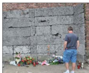
曾经常常枪毙囚犯的一堵墙前，摆着祭奠的鲜花。

看到玻璃窗内成堆的头发和婴儿的鞋子，看到用以关押被判绞刑的死囚的牢房，人们就不由自主地停下脚步，浑身发抖。