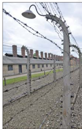
防止囚犯逃跑的铁丝网。