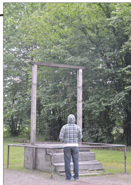
一名青年在绞刑架前沉思。