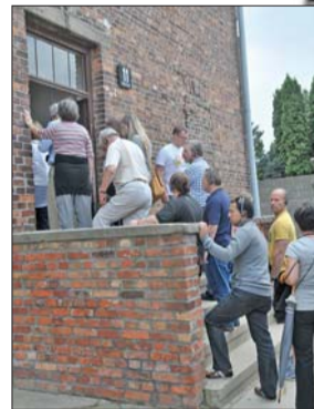
参观的人们无不面色沉重，默默不语。

着一点点光亮，不必回想当年，这个房间就能让人明白什么是毫无生气。让人印象最为深刻的，是尽头的一个房间，被砖头分成了数十个小格子，每个小格子占地不足一平米，“这是站死的地方。”导游低声解释，每个格子会站4个人，蹲不下去，跳不起来，直到犯人筋疲力尽，站着死去。