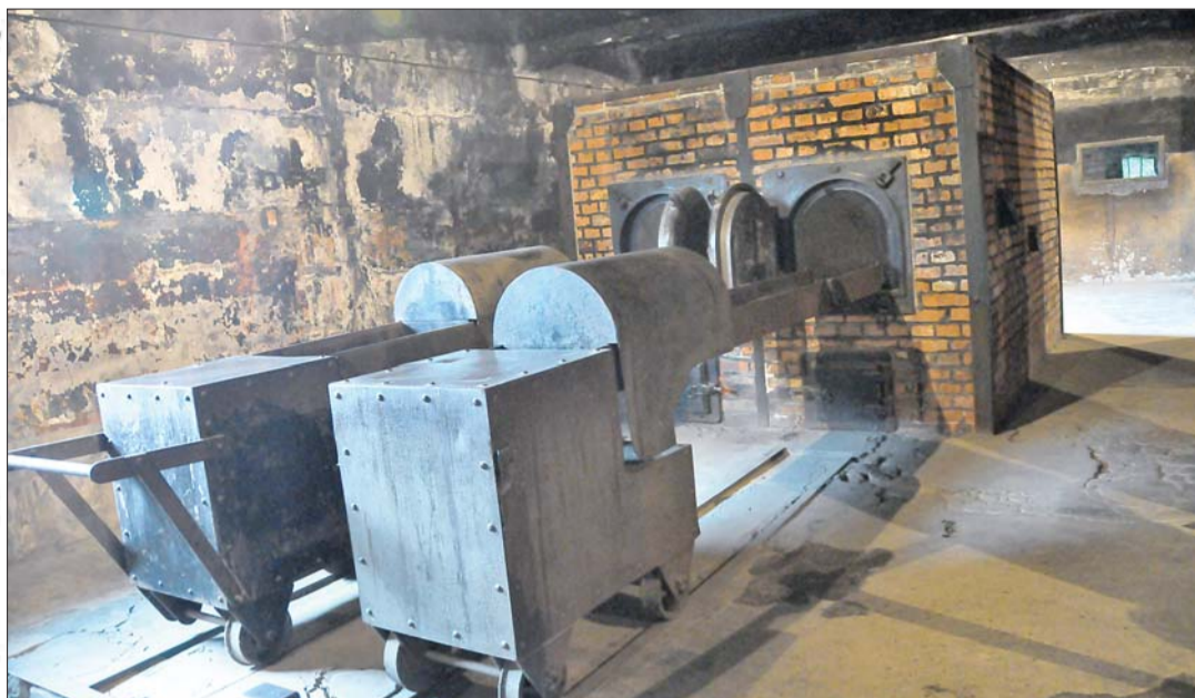
集中营内的焚尸炉。