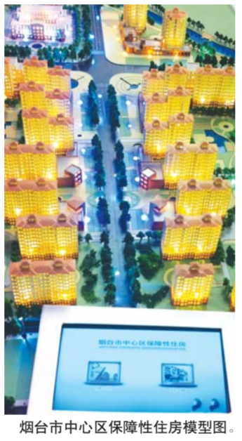
烟台市中心区保障性住房模型图。