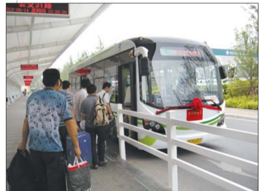
开发区市民乘坐上纯电动公交车。

此外,纯电动车还配备ECARS智能故障诊断系统,驾驶人员可及时掌握车辆的运行状况并协助排除车辆故障,很大程度上降低了车辆的故障率,为乘客安全乘车上了又一层保护锁。