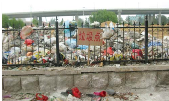
小区内设置的“垃圾点”。