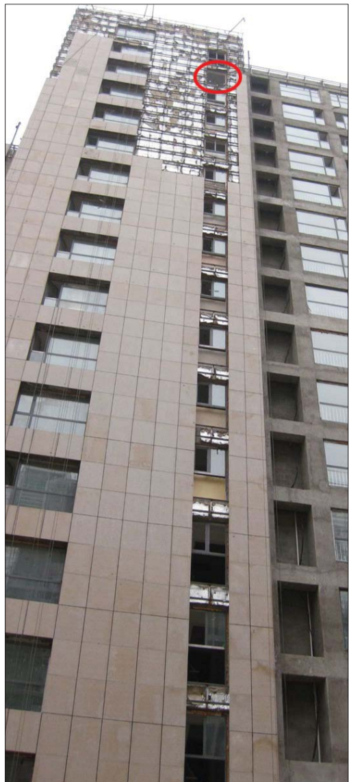
工人从17楼撞碎窗户(红圈处)坠亡。

14日下午2时许,在证大大拇指广场一在建的高楼上,一名工人莫名撞碎17楼楼道窗户坠下身亡,留在两层楼梯台阶中间一个手推车,据工头介绍,事发时,工人正一个人在楼内检修,坠楼原因不明。