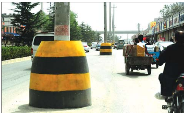
济南黄岗路南段,成排的电线杆立在道路中央。

“刚开始能想方设法地绕着走,可北边这一段井盖子太密集了,绕都没法绕。”附近居住的王女士说,丈夫开车回家只能硬着头皮从井盖子上压着走,一路颠簸不平,自己家的车就曾在这里爆过胎。