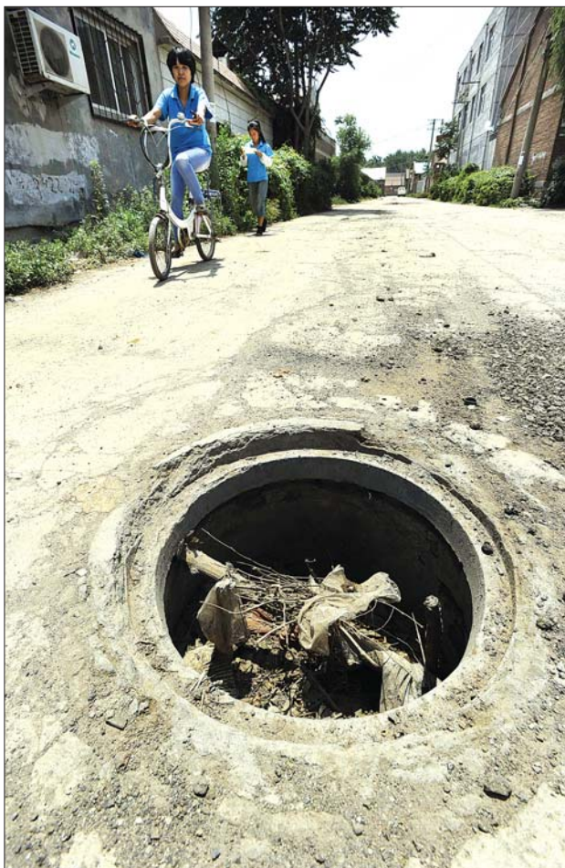
济南黄岗工业园附近,几个地下管道的井盖不翼而飞。

在经十路山东大学门口西侧草坪上,六个井全部张着大嘴。“有通信的,有污水的,都被偷走了。”附近的环卫工人告诉记者,多亏在草坪上,如果在人行道上后果不堪设想。