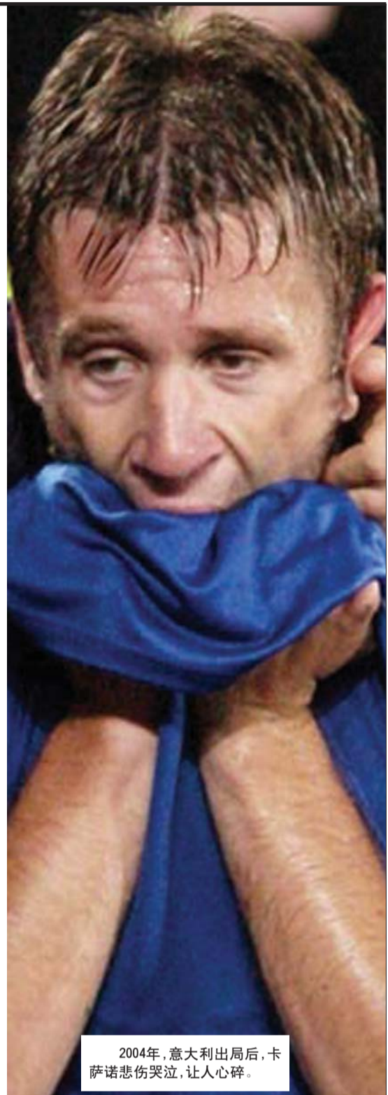
2004年,意大利出局后,卡萨诺悲伤哭泣,让人心碎。

我们只想着战胜每一个对手,从来不会提前设计一个比赛结果,更不关心意大利是否被淘汰。——托雷斯(宗禾)