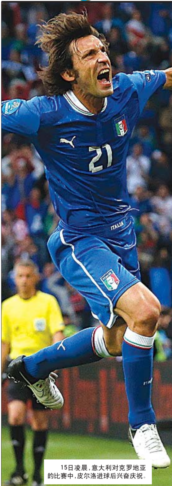
15日凌晨,意大利对克罗地亚的比赛中,皮尔洛进球后兴奋庆祝。