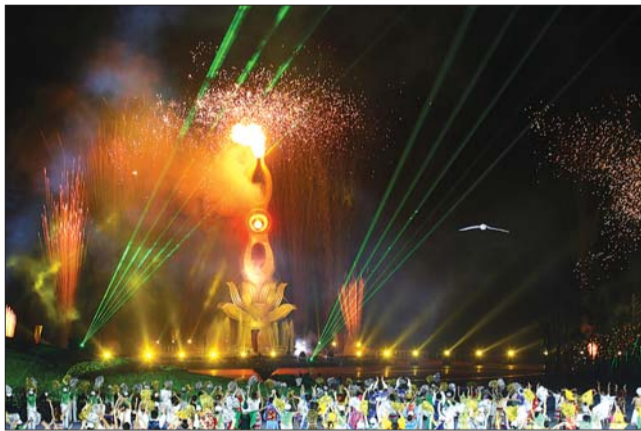
“鸥鸟”衔火种。

路建康表示,火炬点燃过程体现了二火归一,从阿曼取回来的火种与海阳当地的火种合二为一,然后再将“鸥鸟”衔着的和平之火点燃。火炬塔中,水柱将火球托起,象征着水火交融,代表了亚洲大家庭企盼和平的理念。