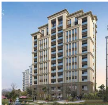
万科·假日风景效果图