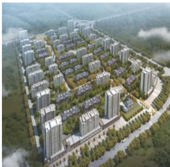
万科·假日风景鸟瞰图

欧洲杯正在如火如荼的热战中,不管最后谁能问鼎冠军,都影响不了狂欢的节奏。借着欧洲杯的东风,万科·假日风景于6月18日举办了“激情欧洲杯,冠军嘉年华”活动,现场活动纷呈,精彩绝伦的足球赛,更有冰爽啤酒、美味糕点和水果沙拉助兴。