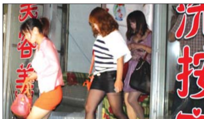
涉嫌卖淫女子被带走。