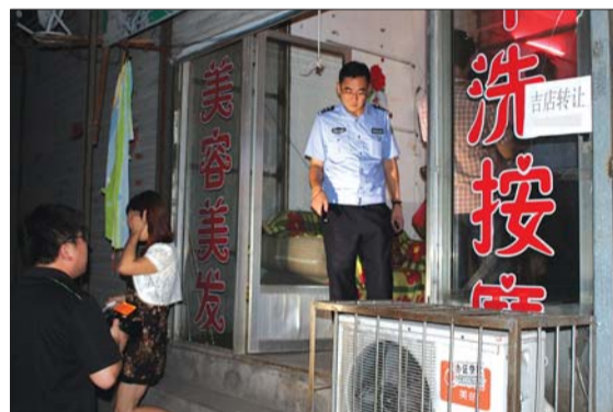
说是洗头房,里面却没有水龙头洗发液等。

8日晚10点30分,南关派出所集中20多名警力,对五马街6家娱乐场所清查,传唤14名涉嫌卖淫嫖娼的嫌疑人,12名涉嫌卖淫女子中最小的才18岁。