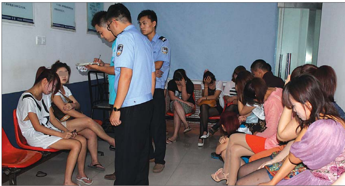
民警调查卖淫嫖娼嫌疑人。