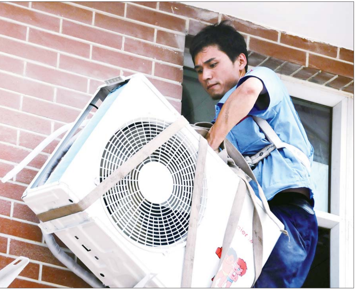
七八十斤的外机,一只手就提出窗户。