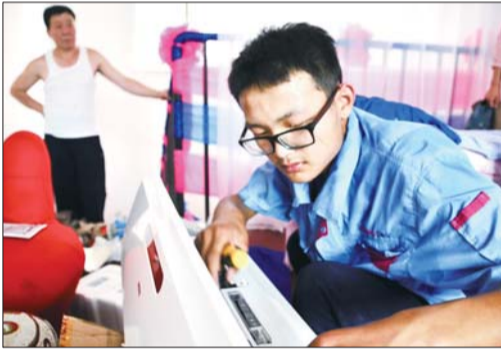
调试机器,挥汗如雨。