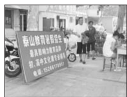
辅导班在马路边招生。

本报96706热线消息(记者 崔维成) 随着暑假的临近,不少假期辅导班开始抢生源,有的辅导班还直接将招生点设在了马路边。