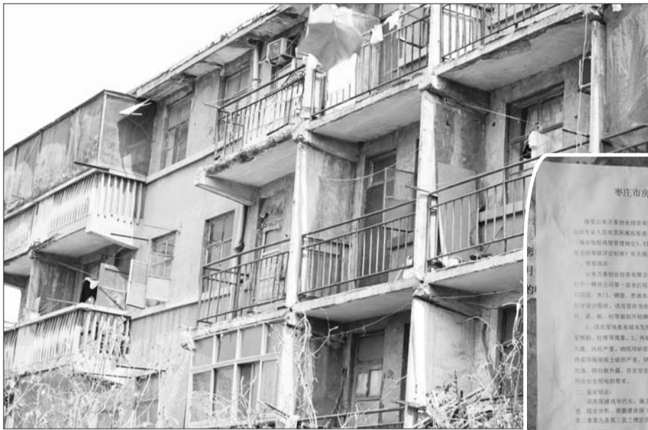
▲水泥阳台楼板和钢筋都露在外面。

从五六年前开始,枣庄万泰纺织有限公司职工宿舍一区九号楼阳台,就不断有水泥栏杆掉落。雨季的时候,还会有污水倒灌入一楼居民家中。近期,住在九号楼的居民们被要求在6月底前撤离自己的家,原因是9号楼已被定为危房。但是,搬去哪、啥时候搬回来等问题都不明确,居民心里没有底。