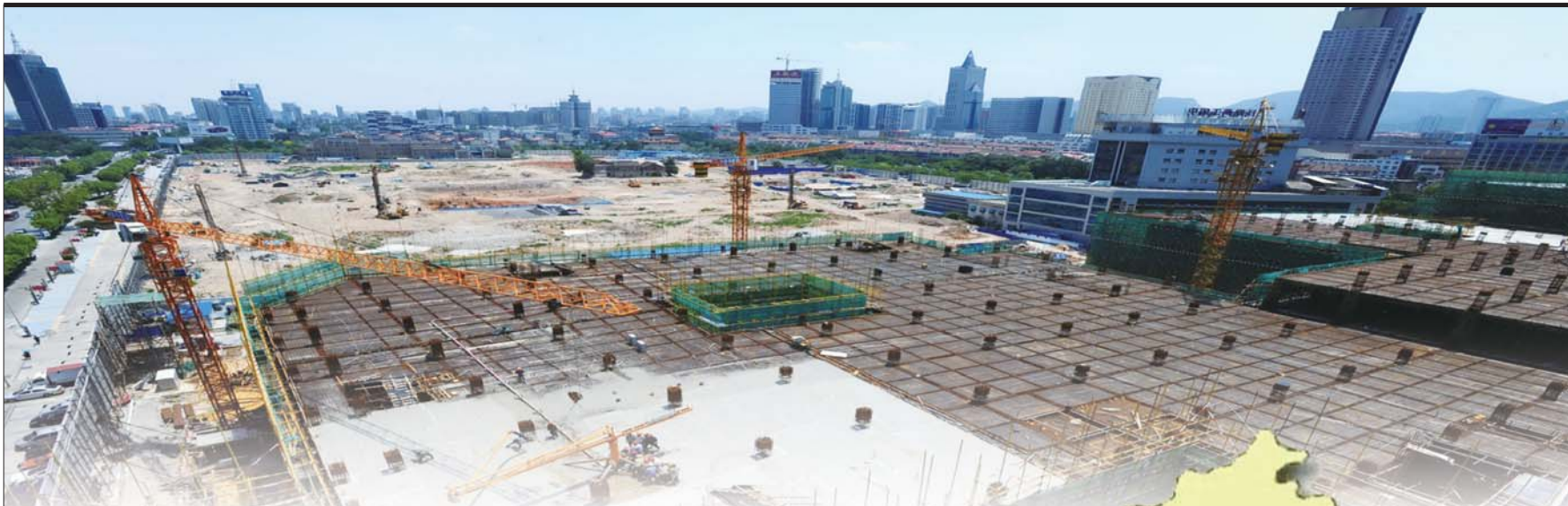
▲历下区的世茂广场正在紧张建设。

6月11日,济南市发布1至4月经济运行和安全生产情况的通报,与以往不同的是,通报对各县(市)区各项经济指标增速排出了“座次”,前三位、后三位一目了然。这些经济数据背后反映了什么问题?数据公布之后相关县(市)区的反响如何?下一步又该怎么办?连日来记者进行了深入采访。