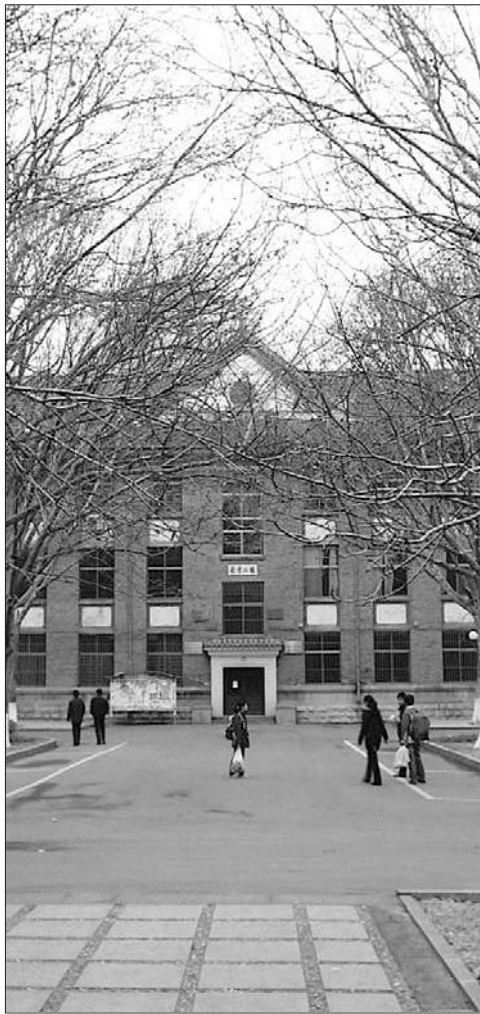
山东师范大学校园一角(资料片)。

曲阜师范大学招生办公室电话: 0537-4458658,网址: http://www.qfnuzsb.com 。