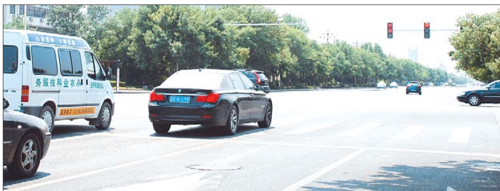
24日,在府前大街上,一辆汽车在斑马线上等红灯。