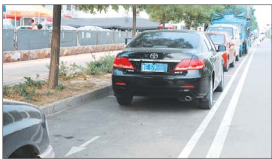
23日,一车辆在辽河路逆向停车。