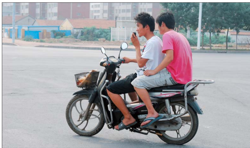
23日,在黄河路辅路上,一市民穿着拖鞋骑摩托车,同时一只手还在打手机。

我们生活在东营,如此在意她的荣誉,为何不能把抱怨摒弃,坚持我们作为一名市民的责任,给城市荣誉增添我们自己的掌声?难道文明驾驶是一件很难的事情?难道我们宁愿给自己的生命绑上不安全因素?一些小问题虽说危及不了生命,可警钟长鸣,事故教训不忘。大路朝天各走一边,驾驶人要养成良好的开车习惯,城市需要良好的交通秩序。车与车,人与人,“难得有相遇的这一瞬间,何不用一笑代替万语千言”。本报倡议驾驶人文明开车,遵守交通规则,摒弃已有的驾驶陋习,把抱怨变成一种责任,共同维护我们的道路安全与荣誉。