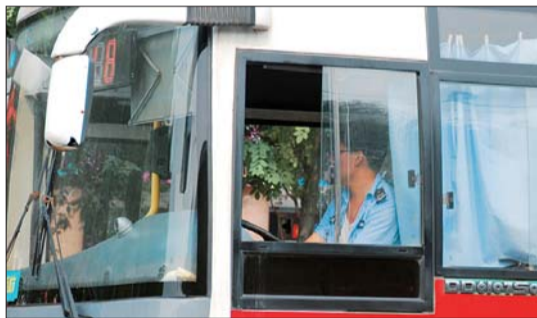
23日下午,在曹州路上,一公交车司机驾驶车辆不系安全带。