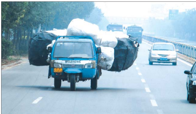
北二路上,一辆满载货物的三轮车,占去两条行车道行驶。