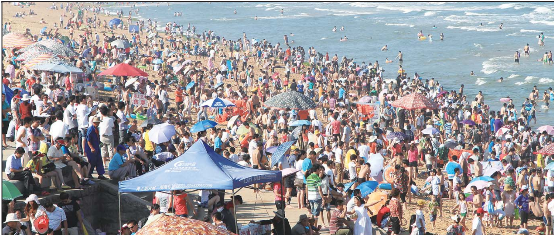
端午小长假第二天,万平口风景区内聚集了众多游客。