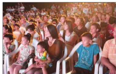
龙城夜宴晚会现场一。