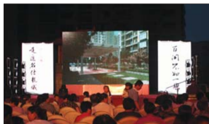
龙城夜宴晚会现场二。