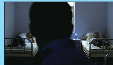
◀毒瘾严重的新收学员住在戒毒所的医务室,有专业医生对他们进行生理脱毒。