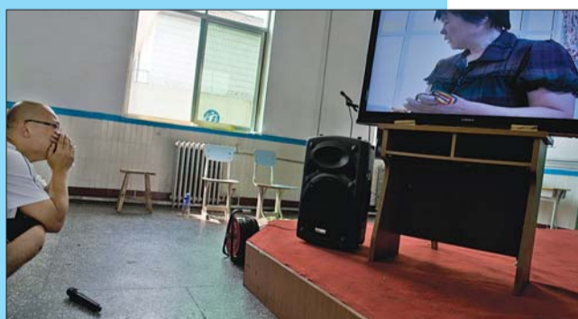
▼来自东营的小伙看到视频中的母亲,涕不成声。