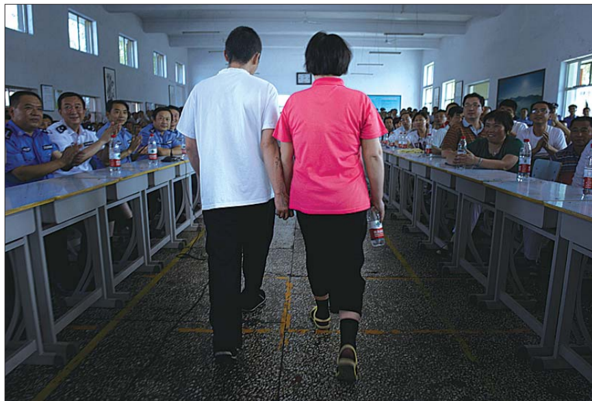
来自四川的一对夫妻,因吸毒被送进距离四公里两个强戒所,因一次活动他们一年多来第一次见面。