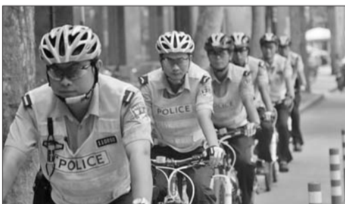
昨日,济南交警首支自行车骑警队在街头执勤。

路等主干道执行巡逻疏导、查处交通违法行为。他们在装备上体现专业骑行的特点,自行车骑警队员全部配备山地自行车,配备专业自行车骑行头盔、防护手套、防刮腿带以及专业骑行配件。其主要理念就是用自行车骑行巡逻的工作展现,向全社会发出倡导,参与慢行交通、绿色交通,低碳、环保出行。