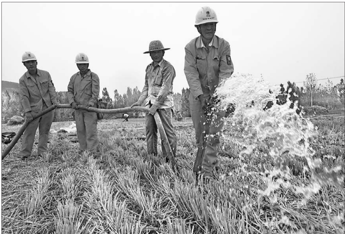
枣庄各有关部门都行动起来,合力保农业灌溉,图为供电部门将临时电源架设到田边,协助当地农民抗旱。