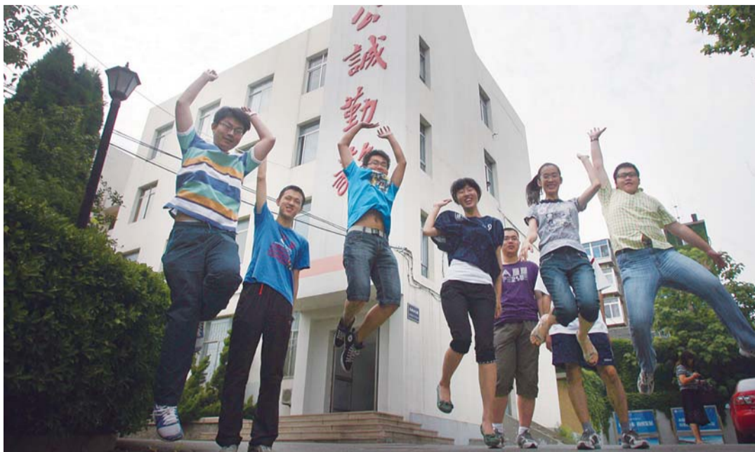
几名高考尖子生高兴地跳了起来。