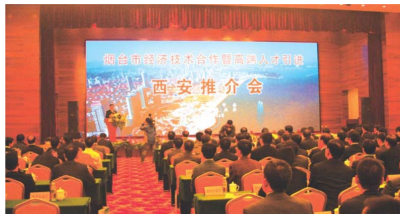
2010年10月24日,烟台在西安的高端技术人才引进会场。

国家“千人计划”共有13人(说明:8人在山东省申报通过,另5人在外省评审通过,在烟台市工作或创业)。