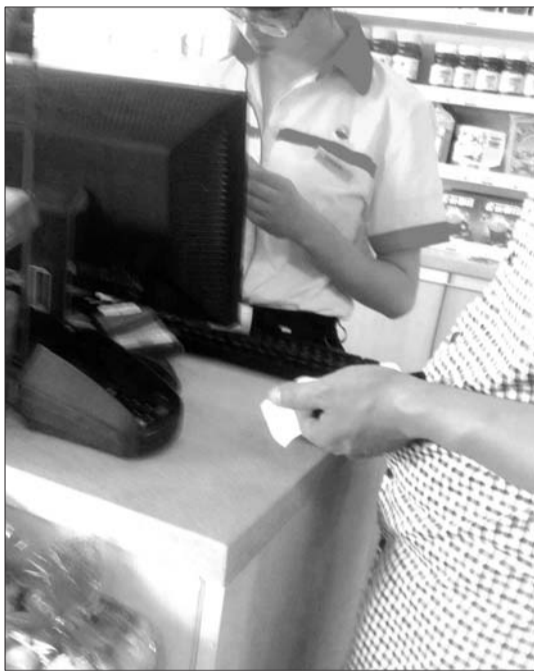
在市区一家加油站,市民在用银行卡为加油储值卡充值。

“现在在外面的一些小商铺都能刷卡消费了,加油站也太落后了吧。”王先生称,现在手里的银行卡有好几张,市区多数商场都有POS机,他已经习惯刷卡消费了,因此平时钱包里的现金很少,没想到这次遇到尴尬。