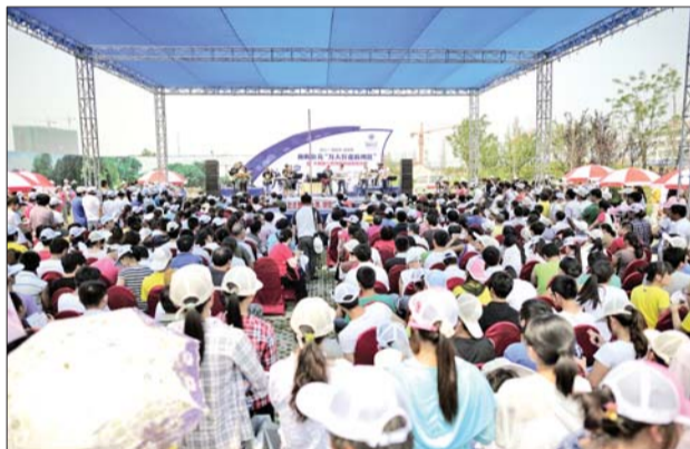
海屿公元活动现场

6月24日,一向不按常理出牌、善于制造新奇和惊喜的海屿公元后湾区,再次以轰动全城的大动作,令这个周末变得格外不寻常。