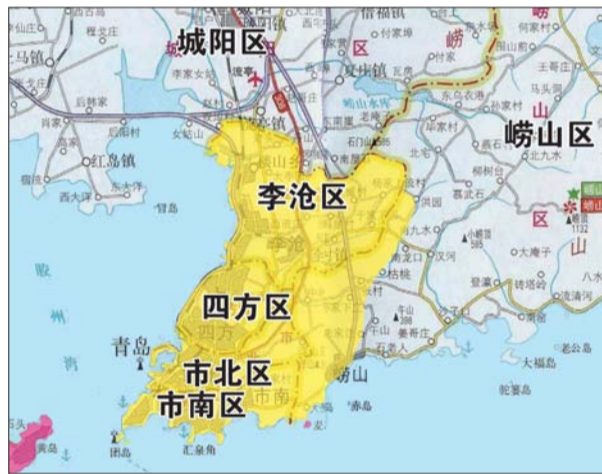
第一阶段为2012年8月1日—2013年7月31日,在市内四区以及崂山区天水路以南、滨海大道以西区域实施限行,限行对象为高污染黄标车。(黄色区域)