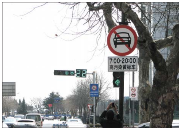
岛城前海一线各主要路口都设置了高污染黄标车限行标志。(资料片)

我们是事业单位,单位有一辆黄标车,我了解到,事业单位的高污染黄标车淘汰是不享受资金补助的。这一点我很不理解。因为单位的黄标车是财政供养的,不是单位自己说了算的,工作用车要更新、淘汰或者处置,都需要上级部门批示。政府对于财政拨款单位的黄标车并没有出台一个具体的处置办法。去年我们单位一直响应政府号召,这辆车尽量不到沿海一线去,但是下一步限行区域要扩大,市内七区黄标车都不能跑了,我们单位只有这一辆工作用车,又不能凭单位自己的财力去更新,对于这种情况,各部门能否协调一下给出解决方案?