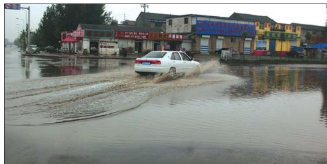
温泉路和南湖大街大面积积水。