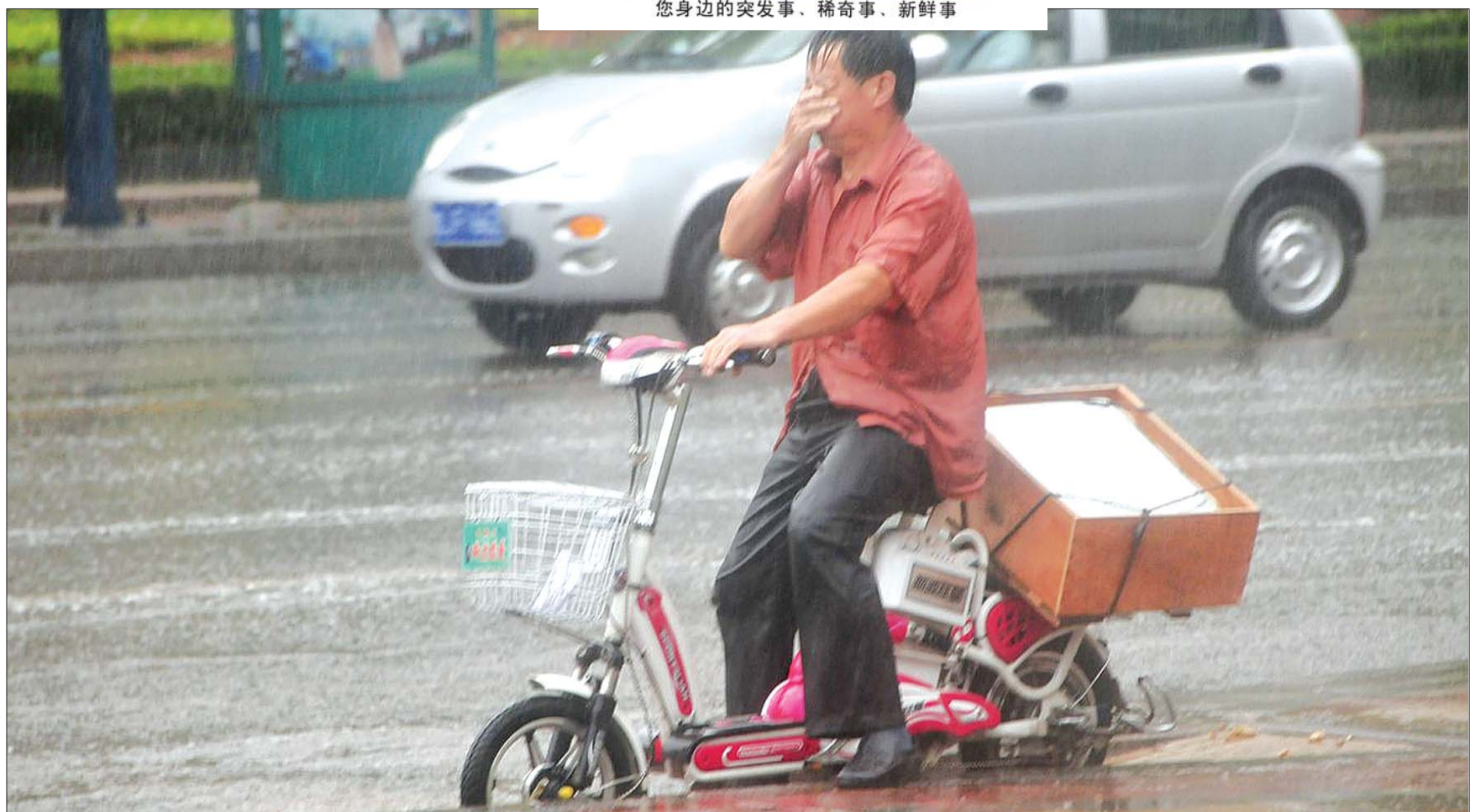
26日中午,龙潭路附近,没带雨具的行人被淋了个透。