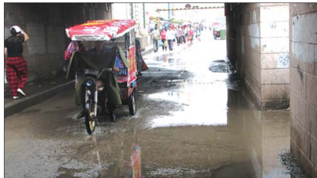
人行道上有一片积水。