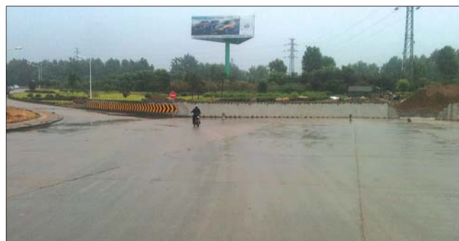
泰玻大街东头积水不见了。