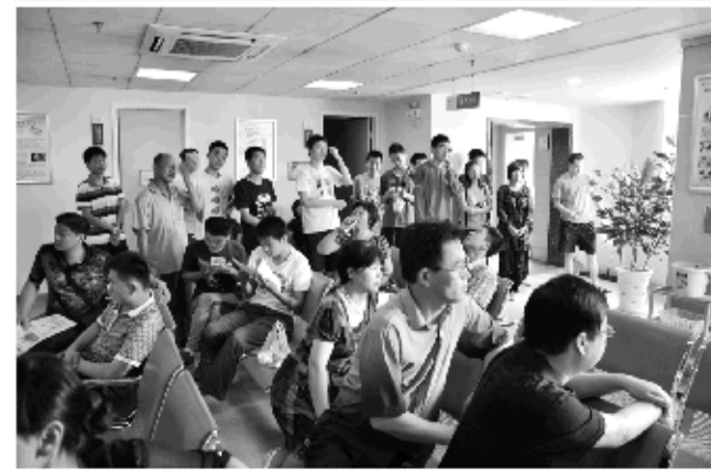
▲大学生扎堆治近视,八成成为爱尔“全景”飞秒而来。

爱尔七周年庆,四重大礼爱心回馈 一重礼:“全景”飞秒七折巨献,自即日起至7月15日,济南爱尔眼科医院激光近视治疗中心十大手术全七折(仅限700名); 二重礼:高考生、在校大学生可持本人准考证或成绩单、学生证全免300元术前检查费; 三重礼:外地患者及家属可享受8天9晚免费星级病房住宿,接送车站及医院路费,术后安排爱心专车送还车站; 四重礼:独有全国40家连锁爱尔眼科医院术后免费复查体系保障,身在外地求学,亦可获得爱尔眼科的关爱。