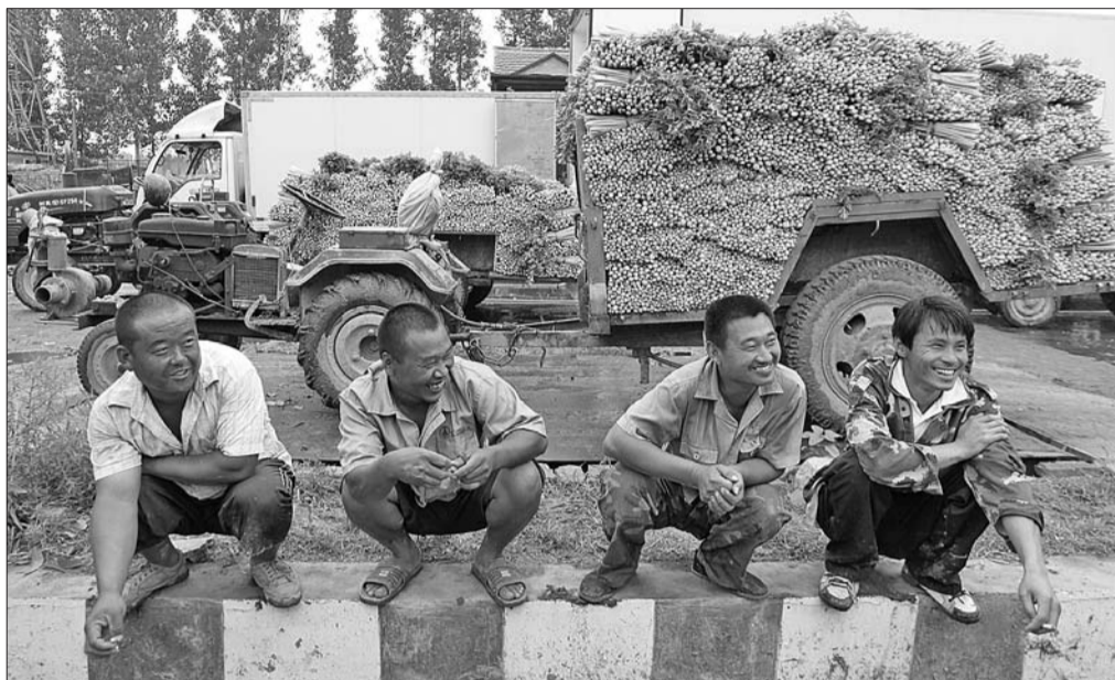
听说有不少商家要来收购芹菜,菜农脸上有了笑容。

除了热心市民外,很多蔬菜批发商也打来电话,询问芹菜的品种、高度、粗细以及当地的制冷、运输条件等信息。聊城一家专门从事蔬菜批发的公司负责人告诉记者,他们的主要销售目的地是广西等地,需要对蔬菜加冰以保鲜,得知当地有制冰厂,他表示将尽快联系车辆到当地收菜。江西的一位菜商在了解了当地情况后,也表示将至少购买5万斤芹菜,“我们的能力有限,但是能帮多少帮多少。”