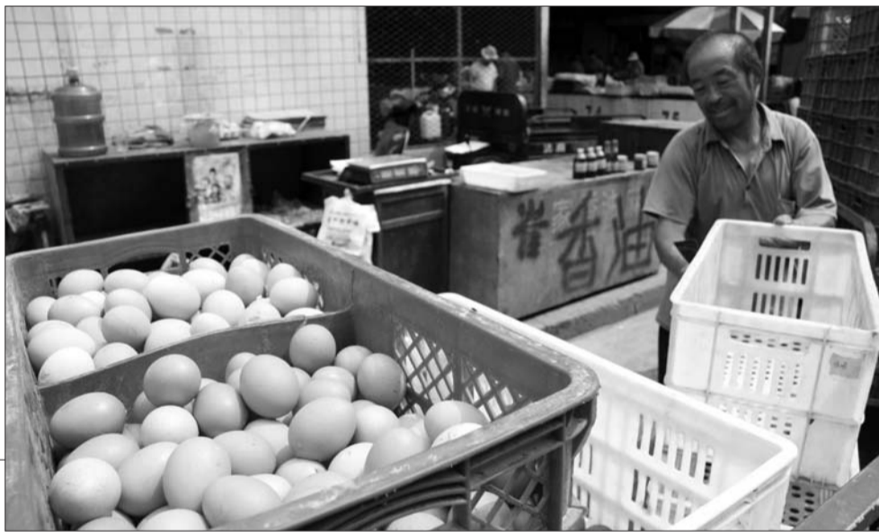
27日,记者从南下河农贸市场了解到,端午节过后,鸡蛋价格持续回升。

本报6月27日讯(记者 杨万卿)27日,记者调查了潍坊市及周边农贸市场及养鸡场得知,端午过后,蛋价又开始出现小幅上涨。