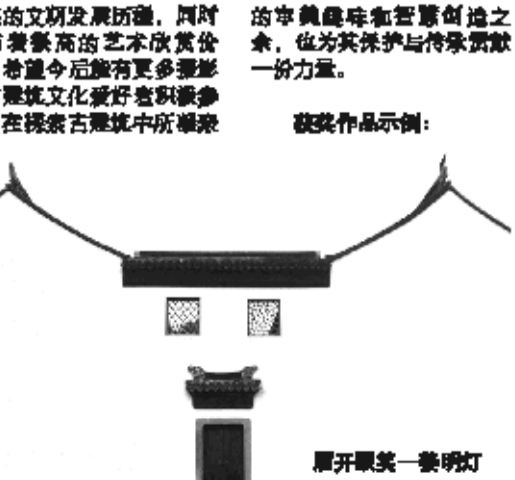
揭开面纱一景明灯

友的关注,共收到来自全国的古建筑摄影作品17万余幅,参赛者遍及政府、企业、高校、媒体等各行各业,甚至还有远涉海外的华人华侨专程前来参加。活动期间,主办方华润雪花在全国组织了数十场外拍活动,并通过专家每日点评、外拍摄影讲座,让参赛者亲身体悟中国古建筑的韵味及中国文化的魅力。 作为华润雪花啤酒一年一度大型活动,“雪花纯生·中国古建筑摄影大赛”兼具人文气息。主办方表示,中国古建筑如同一部凝固的史书,不仅见证了中华