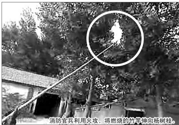
消防官兵利用火攻,将燃烧的竹竿伸向杨树枝。

本报6月28日讯(记者 付志锦 通讯员 夏维函)6月27日下午,高密市阚家镇双羊社区西张秋一居民家中飞进了成群的马蜂,聚集在家门口一棵树上。为了防止马蜂对附近居民造成伤害,高密消防大队迅速出动,采取火攻的办法,将马蜂清除。