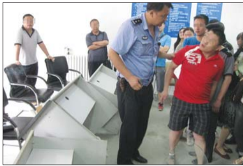
“楼拖拖”开发商再次爽约,业主将开发商的办公桌掀翻,警察在现场协调。

开发商延期交房本也正常,但是四次承诺交房均不兑现,如此多次言而无信的开发商并不多见。本报曾在5月24日报道过“楼拖拖,你能靠谱点儿吗?”一文,报道刊发后,开发商承诺6月28日交房。28日,业主们去领钥匙时,开发商不仅不提供验收报告,还让业主们提前签字验房,业主们拒绝签字,一气之下将开发商的办公室砸了。