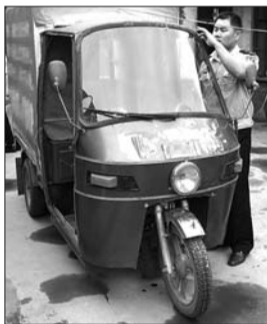
民警找到肇事车辆。

民警迅速调取事故现场北侧巨峰十字路口的监控录像,将事发前经过此路口的蓝色货车全部排查一