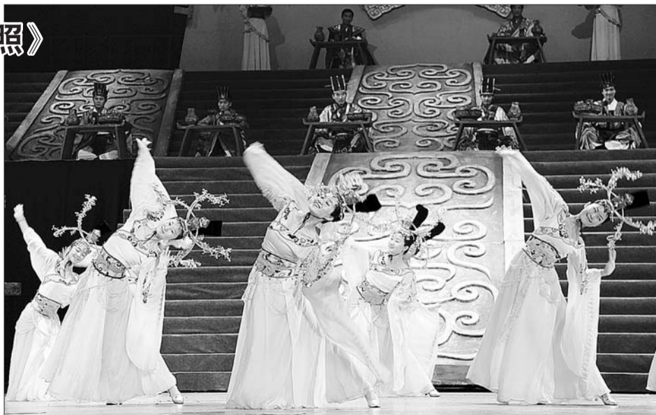
2日晚,2012版《日出先照》首次带妆彩排。