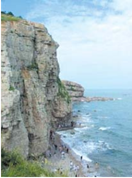
鸟驿站”之美誉,美丽的长岛欢迎您。(长岛)

长岛是中国唯一的海岛国家地质公园、中国十大最美海岛、最佳避暑胜地和国家级重点风景名胜,冬暖夏凉、气候宜人,素有“海上仙山、候