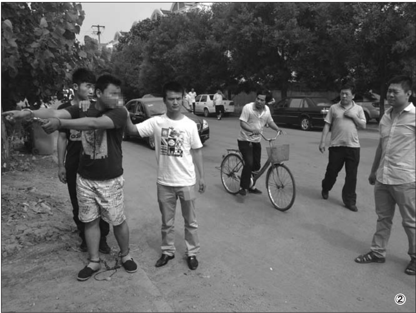
①因为蹲点不利,一名犯罪嫌疑人给“老大”写了悔过书 ②其中一名犯罪嫌疑人在指认作案现场。