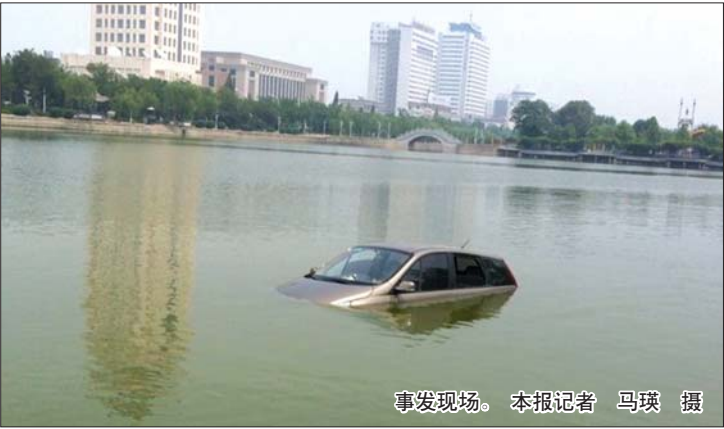
事发现场。本报记者 马瑛 摄

本报7月3日讯(记者 马瑛) 3日中午,有市民拨打本报新闻热线称,观湖城附近的湖面上漂着一辆小轿车。据车主讲,轿车本是停在岸边的,自己去商场逛了一圈,回来就发现车在湖里了。 3日中午12时许,记者在现场看到,一辆灰色小轿车漂浮在湖中,车门紧闭,驾驶舱内没有人,左右侧的车玻璃半打开,有不少市民围观。 记者看到小轿车靠近岸边的一侧是一段宽阔的阶梯,阶梯上的石板砖有的已经破碎,溜车的划痕较明显。“应该是溜车溜进湖里的。”围观群众说。 随后,轿车车主来到现场,她无奈地告诉记者,停车时并不是她开车,她记得下车时车窗都是关闭的,去商场逛了一圈回来就发现车在湖里了,并不清楚车是怎么进到湖里的。 据车主讲,车买来才一年,3日上午去一家保险公司续交保险,保险公司的电脑有故障没能办好,让她下午