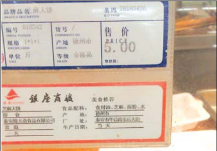
超市内食品专柜上面生产日期标注“当日”“当天”。