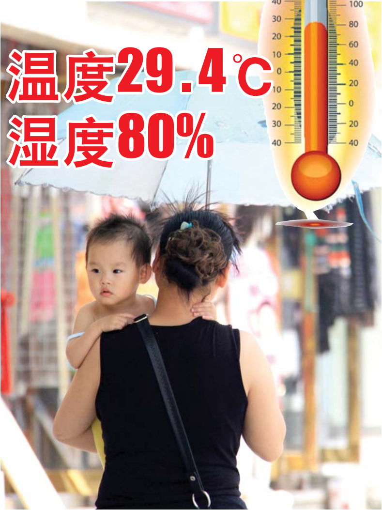
出行市民为避免太阳照射打起遮阳伞，4日仍会比较闷热。