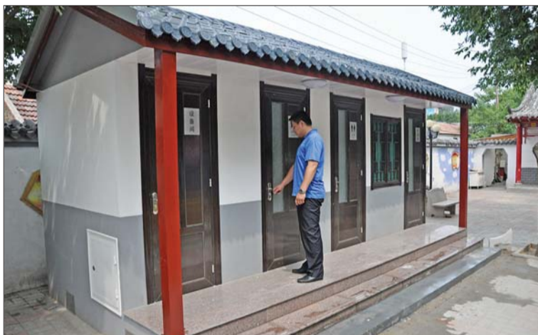
曲水亭街北头,一座崭新的环保仿古公厕亮相。

历下区城管局相关负责人介绍,全区今年计划新建的30座公厕都已全部建成,而且全部为这种“飘香”型。另外,他们还将携手园林部门,对新建公厕进行屋顶及立面绿化,在便民的同时,扩大绿化面积,使新建公厕成为城市一道靓丽的景观。