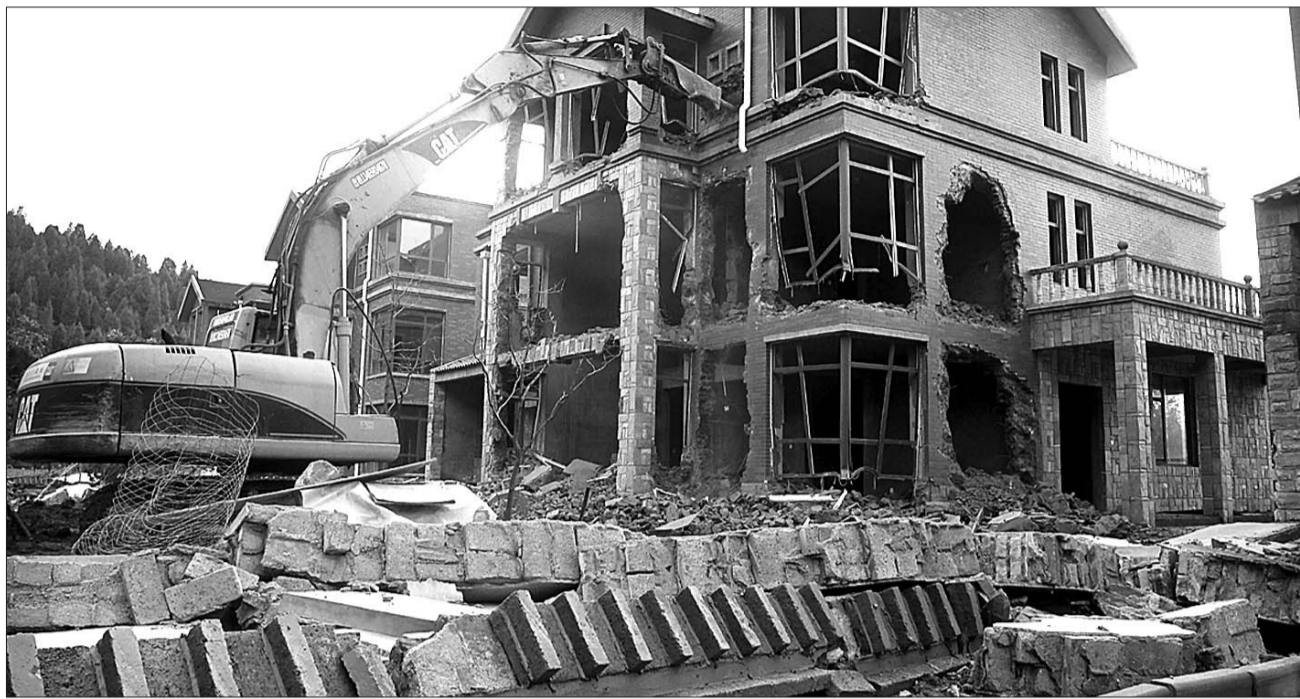
7月5日19点左右,执法人员在拆除卧虎山水库南岸的违法别墅。

本报济南7月5日讯(见习记者 宋立山) 3日本报A05版刊发《卧虎山水库野别墅死灰复燃》一文,报道济南南部山区水源地又现毁林开山、私建别墅的现象。报道见报后,济南市国土部门、执法部门和别墅所在地仲宫镇政府联合调查,认定两处别墅均为违法建筑。5日下午,当地执法部门开始强制拆除其中一处的4幢野别墅。