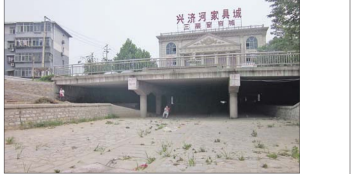
兴济河上建起了商城。

●链接: 省城泄洪河道基本上都是自然形成的,这就是人们通常所说的明沟,现存的大小明沟有67条之多,而主要的排洪河道有30余条。 由于济南地形南高北低,所以河流总体流向是从南向北,几条南北向河道也大体上构成了城市泄洪的主渠道。