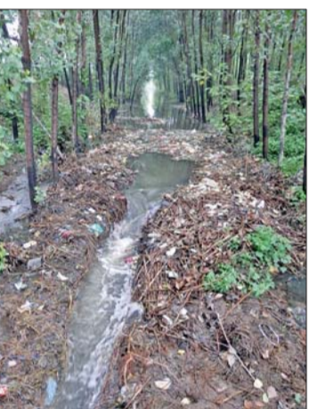
土河河道里种树,淤积了不少垃圾。

进入汛期,济南降雨开始增多,高强度集中降雨形成暴雨洪水和较大汛情的几率也明显增加,具有泄洪功能的河道再度成为济南市民关注的焦点。泄洪河道是否通畅,能否正常发挥泄洪排水功能,近日,记者对此进行了探访。