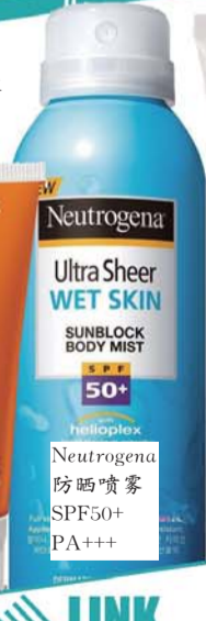
Neutrogena Ultra Sheer WET SKIN SUNBLOCK BODY MIST SPF 50+ PA+++