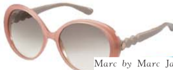
Marc by Marc Jacobs