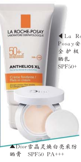
◀La Roche-Posay安得利全护极效防晒乳 SPF50+