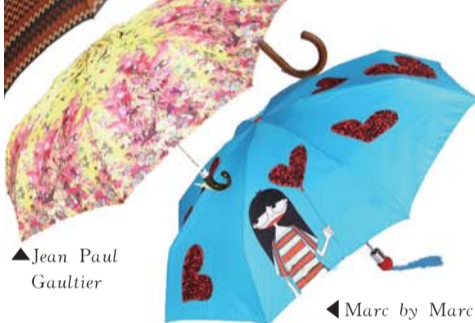
▲Jean Paul Gaultier