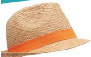
▲Designers Remix Collection

炎炎夏日，凉爽可人的巴拿马草帽不仅是防晒利器更是百搭得很，所以成为夏日里不可或缺的单品。巴拿马草帽由来已久，但大品牌每一年夏季都会相应推出一些新的款式，因为这款帽型着实经典不衰、百搭有型，我们不但常在一些电影画面中捕捉到其优雅“身影”，在现实生活中，也是好莱坞女星夏日出街的最爱单品之一。