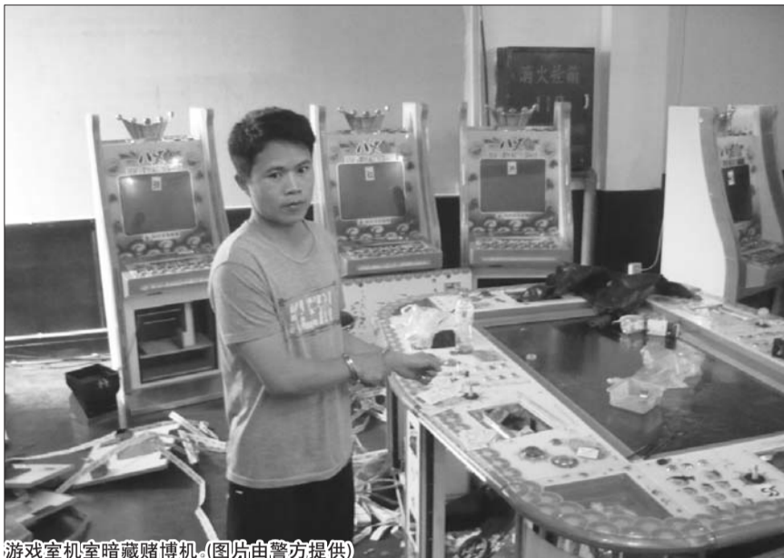
游戏室机室暗藏赌博机。