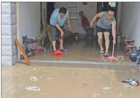
▲居民忙着清理地下室积水。