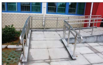
门前有斜坡,方便轮椅通过。