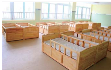
宿舍楼一至三层是大房间,婴儿床已经放好。