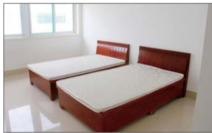
宿舍楼四、五楼是标间,为大点的孩子准备的。