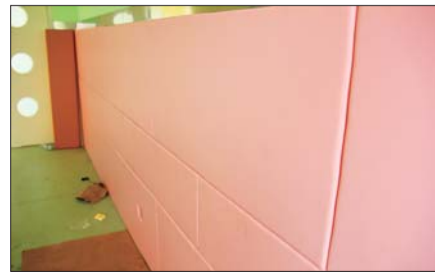
内墙面是软胶的,防止孩子磕着碰着。