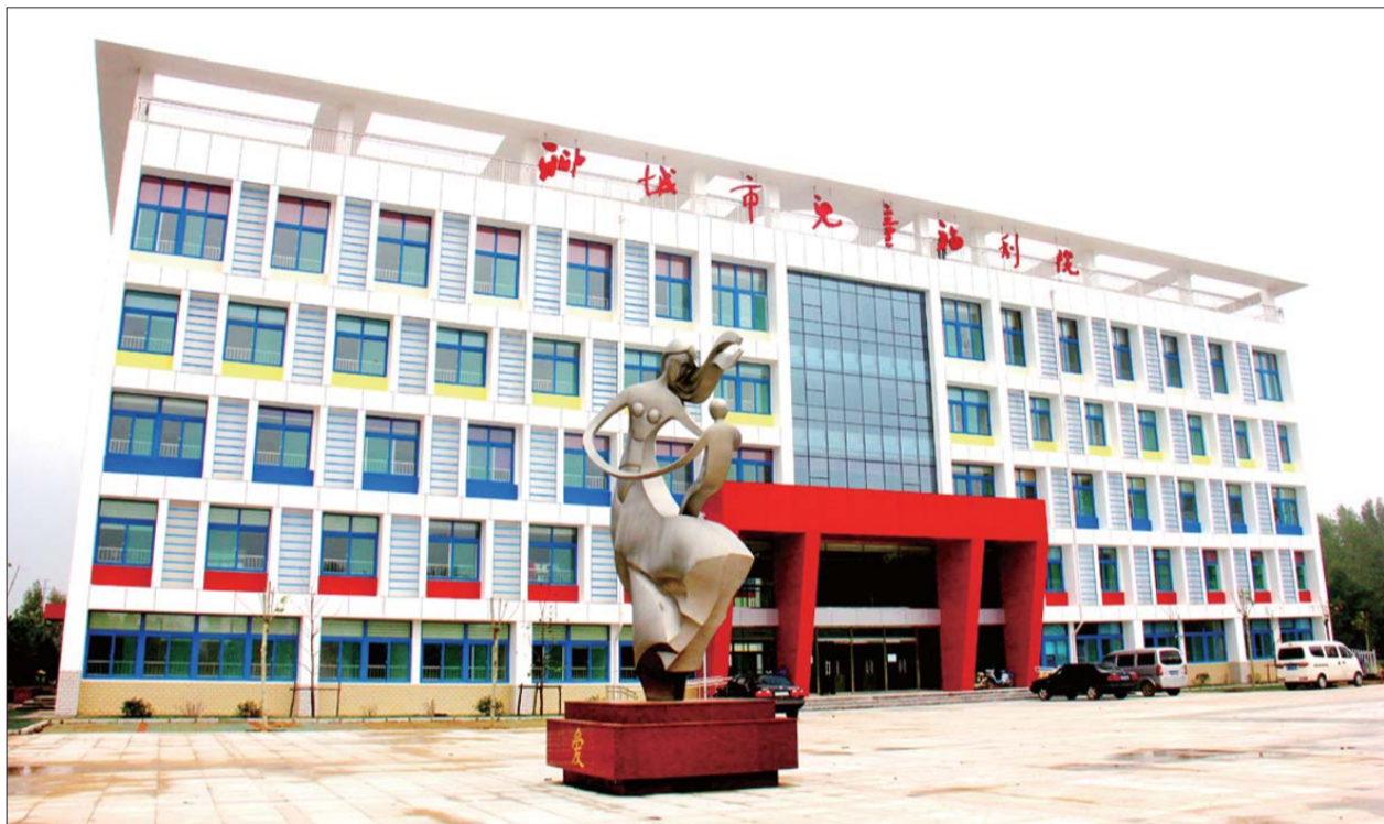
8日,聊城市儿童福利院基本建成完工,外观很漂亮。