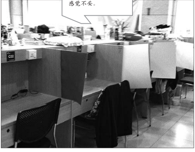
▲收费自习室的座位都是隔开的。

学校设有有偿自习室,你觉得是否应该?欢迎通过96706热线,齐鲁晚报官方微博、QQ等参与讨论。