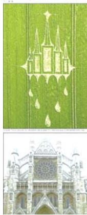
这是首次发现麦田怪圈图案并非抽象图案,而是类似实体建筑。

报道称,该麦田怪圈出现在英格兰威尔特郡的斯坦顿·圣伯纳德,这一麦田怪圈出现在一夜之间。报道评论称,这是首次发现麦田怪圈图案并非抽象图案,而是类似实体建筑。据悉,在过去数周,人们在英格兰威尔特郡已发现了好几处新的麦田怪圈。