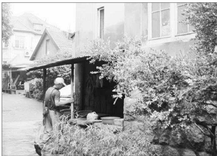
江苏路附近的学区房,很多都是上个世纪40年代以前的老房子。李珍梅 摄