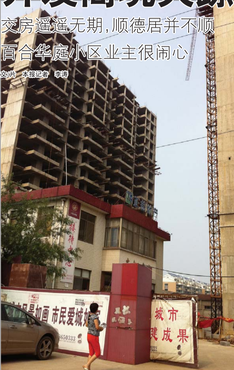
百合华庭小区已经停工。