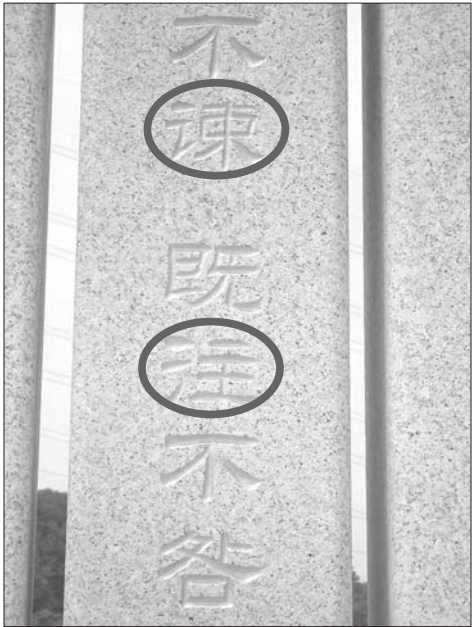
“谏”字少了两点,既往不咎写成了“既注不咎”。

一下,发现缺“点”缺“撇”的地方确实都有刻痕,但阅读者看着这些漏涂金粉的字,很容易误认为是错字。记者大致数了一下,问题字大致有十余处。 该负责人仔细询问了在场学生问题字有哪些,一一记录到手机里,并表示会尽快修改。“因为这块碑刚建好约有一周时间,所以可能会存在些问题,希望学生们发现问题及早反映,以便及早解决。”该负责人说。