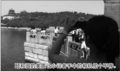
颐和园的美景让小记者手中的相机拍个不停。